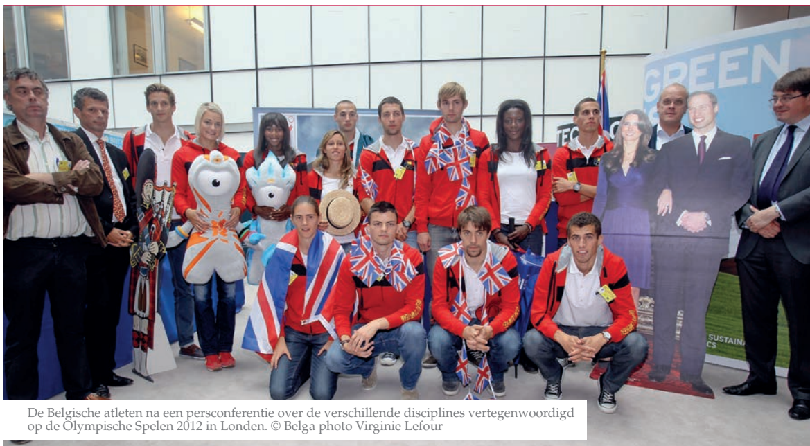
De Belgische atleten na een persconferentie over de verschillende disciplines vertegenwoordigd op de Olympische Spelen 2012 in Londen.