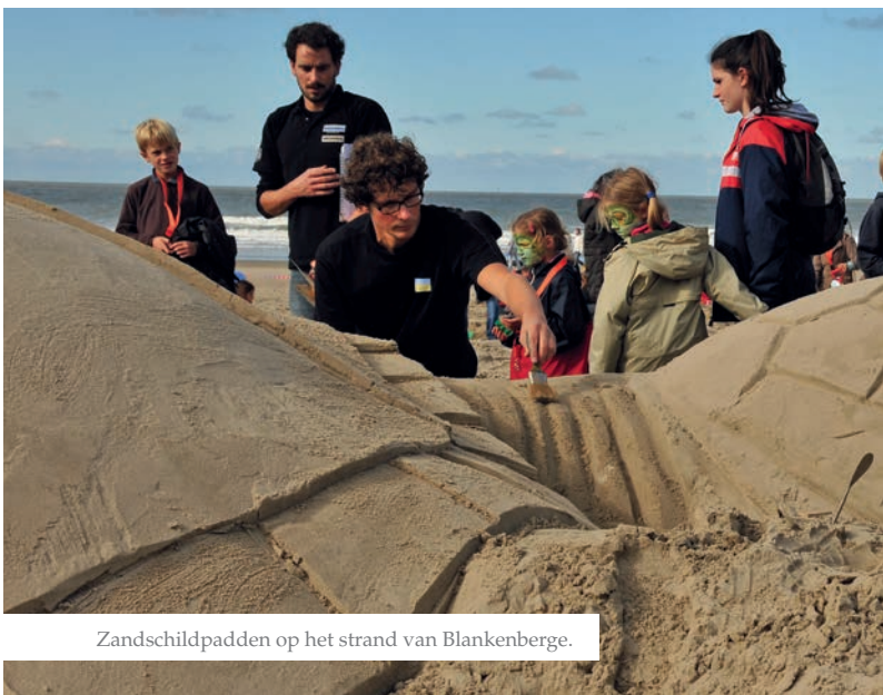
Zandschildpadden op het strand van Blankenberge.

In het kader van de oceanencampagne zette het WWF twee educatieve projecten op poten om ook kinderen van deze problematiek bewust te maken. Zo leerden ze op een leuke, actieve en laagdrempelige manier over de oceanen en hun bewoners. «De scholen die een lespakket bestelden», vertelt De Winter, «kregen educatief materiaal toegestuurd met posters van oceaانبewoners. Aan de hand van educatieve fiches, onder andere voor tijdens de zwemles, leerden