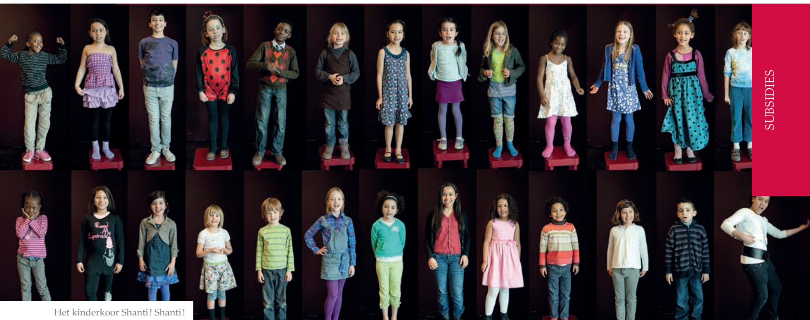
Het kinderkoor Shanti! Shanti!