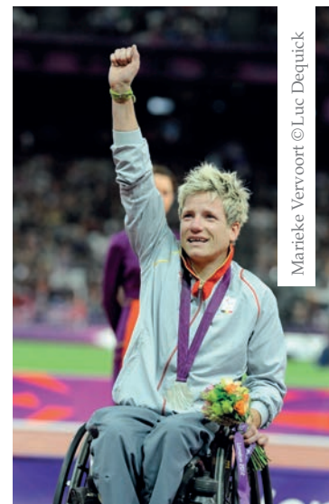
Marieke Vervoort